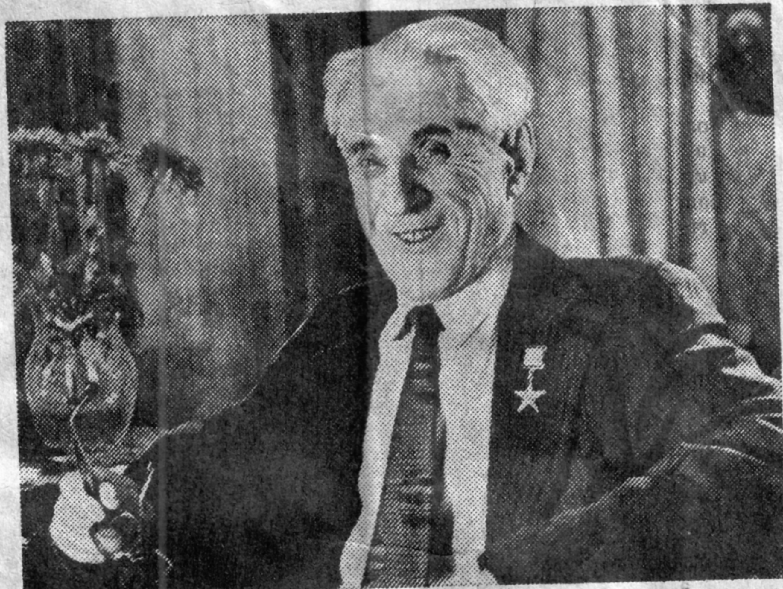
Фото военных лет и автора.